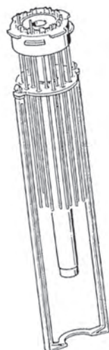
Patentierter Auszug zur einfachen Reinigung der Lampe und des HV-Gitters